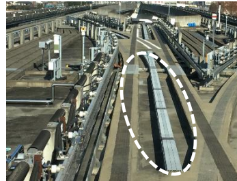
▲ へこみ部の例(点線内) 走行路中央のくぼんだ部分

分岐部の走行路において、“へこみ部”の段差を解消する部材を設置し、段差解消により、万一脱輪した際の衝撃を緩和することで、発災時の安全性の向上を図ります。