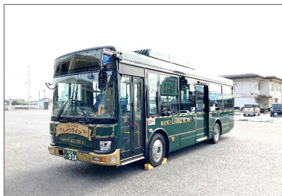
＜レイクライン新車＞

三大菓子処・「茶の湯文化」を表現した『緑』を基調とし、それまでの赤を基調としたものから大きくイメージが変わりました。