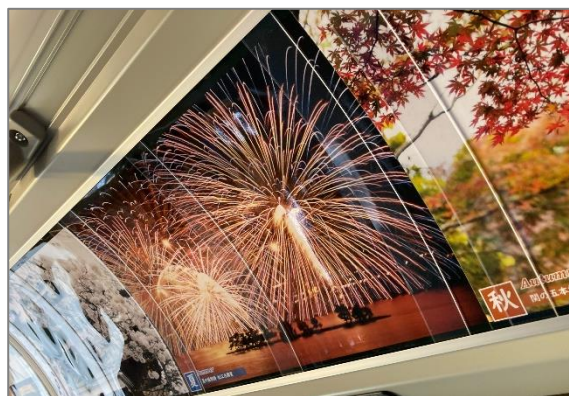
＜車内に松江の“四季”を展示＞

レイクライン車内では、松江の夏の風物詩である「松江水郷祭湖上花火大会」や冬の堀川遊覧船「こたつ船」など四季折々の松江の風景写真を展示しています。