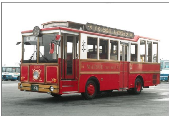
＜初代レイクライン車両＞

車内にはモニターを設置し、本局バスガイドによる観光案内を見ながら松江観光を楽しむことができ、多くの観光客の皆さまにご利用いただいています。