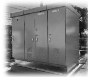
受変電設備（上）、充電器（右）