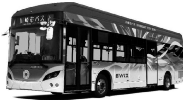
電気バス外装イメージ

また、今後は、当該電気バスに 再生可能エネルギー由来の電気を使用することを検討 し、電気バスの運行に係るCO2排出量実質ゼロを目指して取り組んでまいります。