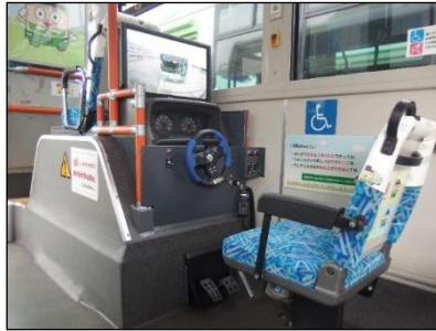
こども運転席の内観