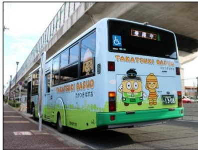
たかつきバスお号の外観