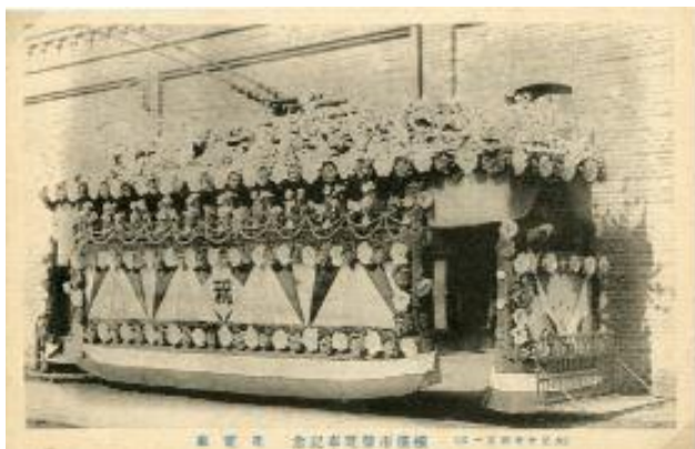
横浜市電気局誕生記念花電車 (横浜都市発展記念館所蔵)