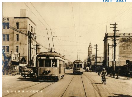
関東大震災復興後の市電

横浜市営交通は2021年4月1日に100周年を迎えます。 横浜市営交通はこれまでに市営交通を支えてくださったお客様・市民の皆様に感謝を伝えるため、様々な取組を実施します。