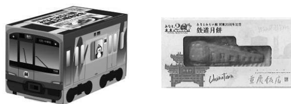
コラボ商品(一部) (左:崎陽軒様 右:重慶飯店様)

2月3日に開催した「みなとみらい線まつり」では、各社様ご出店のもとコラボ商品を販売し、お客様から大変好評をいただきました。