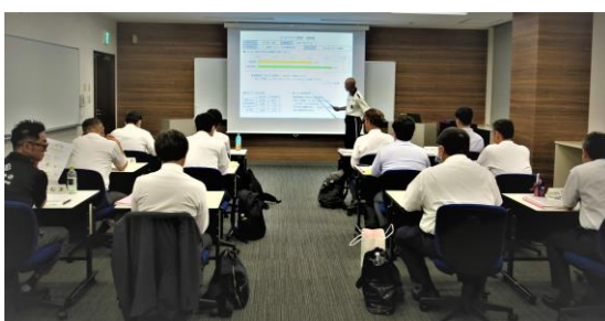
省エネ運転診断結果の説明を受ける様子