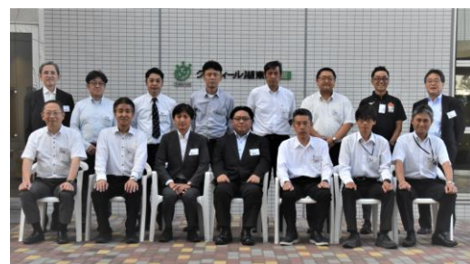
直井講師と研修生等全員での記念撮影