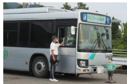
運転時の死角の説明を受けている様子