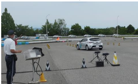
「運転と反応」実習で見事なハンドルさばき風景