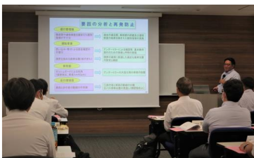
東京都交通局直井講師による講演の様子