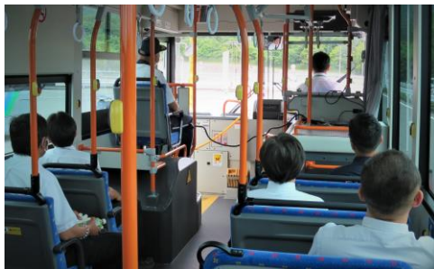
省エネ運転の実技指導を一人一人インストラクターから受けている様子