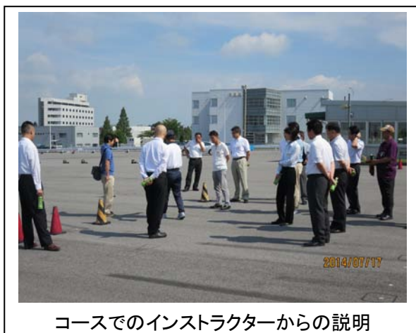
コースでのインストラクターからの説明