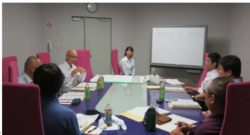
グループ討議の様子