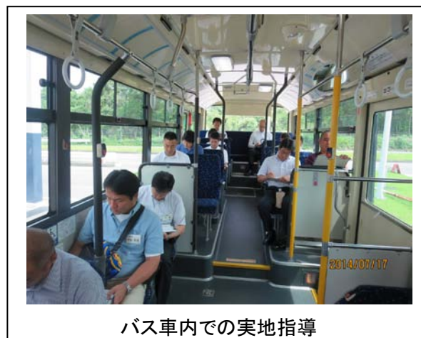
バス車内での実地指導